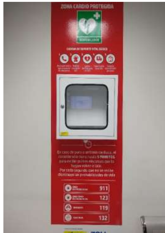
Figuras 9 y 10 Se cuenta con DEA en el área Comercial, para la atención en caso de una Urgencia.