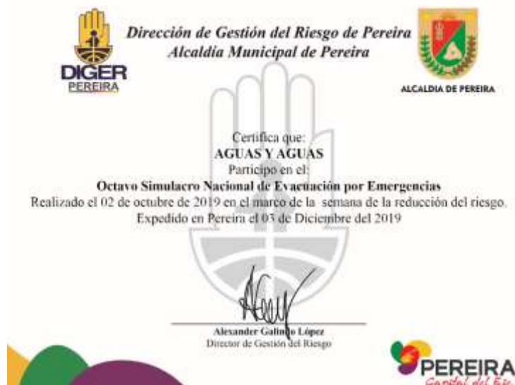
Figura 15 Certificado de participación en el Simulacro año 2019