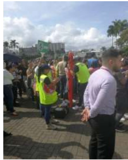
Figuras 11,12, 13 y 14 Simulacro Nacional de Evacuación por Emergencias año 2019.