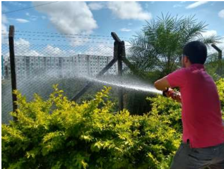
Figuras 6, 7 y 8 Revisión estado de Gabinetes contra Incendios