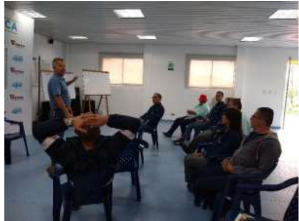
Figuras 2,3,4,5. Realización de formación en las diferentes sedes de Aguas y Aguas

Se realiza verificación sobre el estado de los gabinetes contra incendios y funcionamiento de la red hidráulica de la sede de operaciones, en caso de presentarse un incendio.